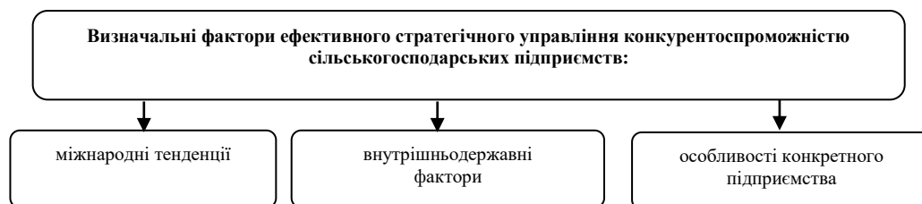
Рис. 1. Визначальні фактори ефективного стратегічного управління конкурентоспроможністю сільськогосподарських підприємств

Дослідження існуючих реальних умов конкуренції є основою стратегічного управління конкурентоспроможністю підприємства, на що звертає увагу зокрема і Ф. Хаєк [5, с.20-21]. На основі аналізу сучасної ринкової кон'юнктури слід виокремити три групи серед яких виділяти ключові сучасні виклики, які слід неодмінно враховувати задля забезпечення ефективного стратегічного управління конкурентоспроможністю сільськогосподарських підприємств: 1) міжнародні тенденції; 2) внутрішньодержавні фактори; 3) особливості конкретного підприємства (рис. 1).