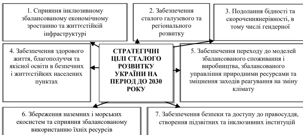
Рис. 2. Стратегічні цілі сталого розвитку України на період до 2030 року в контексті інклюзивності (сформовано автором за даними [14])

Стратегічні орієнтири сталого розвитку нашої держави у контексті інклюзивності знайшли своє відображення в проекті Стратегії сталого розвитку України на період до 2030 року. Розроблений документ містить цілісну систему стратегічних та операційних цілей та відповідних індикаторів переходу до інтегрованого економічного, соціального та екологічного розвитку країни до 2030 року й будуватиметься на 17 глобальних Цілях сталого розвитку (рис. 2).